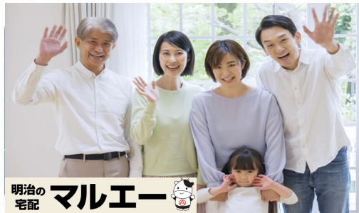
明治の 宅配 マルエー