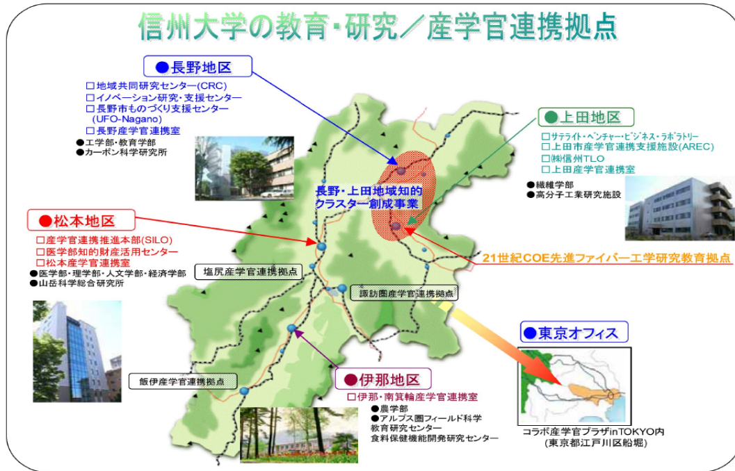
第117回役員会資料『地域とともに』（7頁）より抜粋